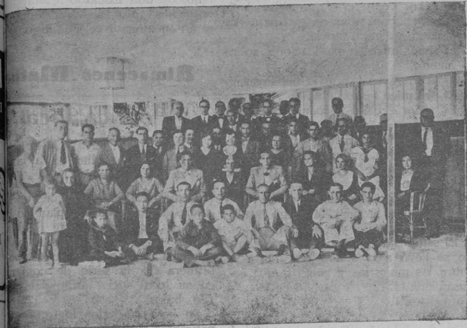
domingo pasado la Empresa del Saón Realto, Teatro Victoria y Bal- nario de S'Àigo-Dolça obsequió a todos sus empleados con un ban- quete servido en el mismo restaurant del citado balneario