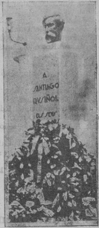
Sitges. — Monumento a Santiago Russinyol, erigido con motivo del aniversario de su muerte

Mort Rossinyol—acabà dient el se- nyor Estelrich—, els catalans el pos- seïm més que mai, i aquest monu- ment és penyor d'aquesta possessió. Els pobles s'honoren honorant les se- ves figures representatives, i Catalu- nya, en retre homenatge a Santiago Rossinyol, fa present que li plau més de redossar-se darrera la grandesa dels seus homes que no darrera la curenya dels canons».