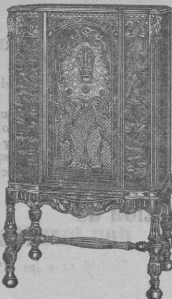
ONDA CORTA y LARGA