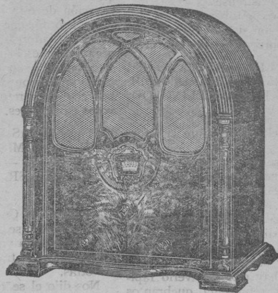
ONDA CORTA y LARGA

Un solo mando directamente a la corriente alterna Control de tono gran selectividad Demostraciones a solicitud