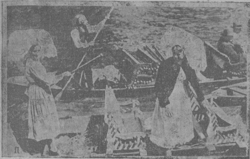
Sprewald (Alemania).—Jóvenes alemanas dirigiéndose en bote a la foresta donde se celebran las típicas fiestas de Primavera