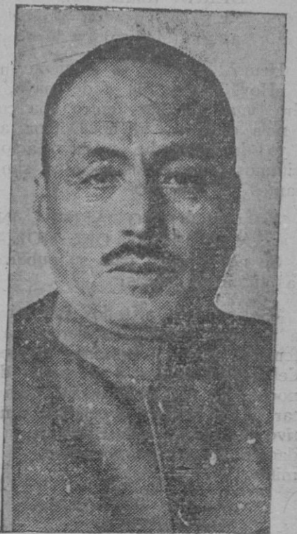
El general japonés Shirakawa, herido gravemente en el atentado cometido por un coreano en Shanghai

el proyecto y presupuesto del grupo escolar del glacis de Santa Catalina. Dicho grupo consta de 24 secciones escolares, distribuidas en dos cuerpos de edificio con tres plantas, poseyendo servicios anejos muy completos; cantina, dependencias para museos, trabajos manuales, salón de actos y proyecciones, etc.