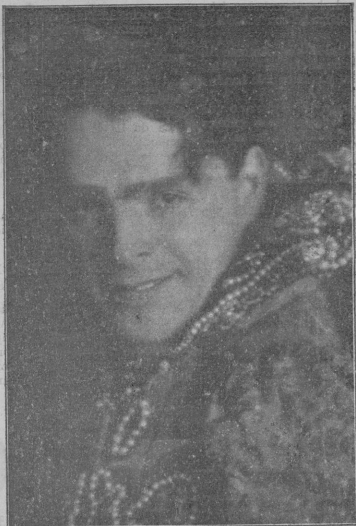
El eminente tenor ruso que hoy se presenta con sus conciertos de lieds, en el Teatro Principal