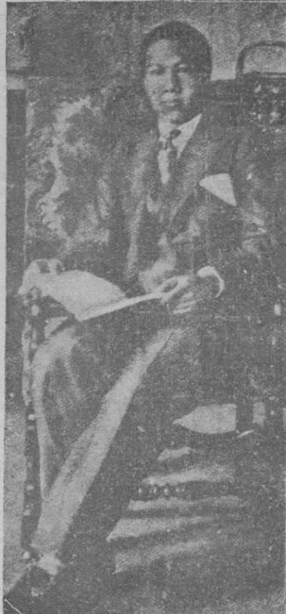
El emperador de Annam, que ha embarcado con dirección a España, con el propósito de visitar Madrid y continuar luego su viaje hacia la capital de Francia

sar—, en nombre de mi tío, que en gloria esté. Yo soy Indalecio Prieto, nada más. García Prieto era un tío mío. Que murió.