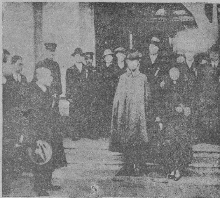
Henry Fu-yi, hijo del último emperador de China, y que ha sido proclamado jefe del Estado manchú

República Española, siendo unitaria, siendo un régimen nacional para España, ha venido entre otras cosas, a dar selva, a liberar los sentimientos y los intereses regionales, contradiciendo y borrando para siempre la opresión del unitarismo anterior, que no se fundaba en un unitarismo de carácter nacional, sino en el unitarismo de carácter dinástico, como si la unidad de la persona reinante obligase a todo el país a modelarse bajo un régimen uniformista único, centralizado borrando todas las diferencias nacionales y regionales. Esto era una imposición del régimen dinástico; pero en el régimen de libertad que representa la República, además de ensalzar la personalidad individual, restituyendo a los españoles su calidad de ciudadanos libres, restituyendo a las regiones de España su propia independencia y libertad, para que ellas se extiendan hasta donde el genio local la permita en una noble competencia, bien seguros nosotros, los gobernantes republicanos, de que al hacerlo así, lejos de romper los lazos de la uniformidad nacional, los apretamos en una unidad que nadie, ninguna voluntad, podría romper jamás. (Muy bien, grandes aplausos.)