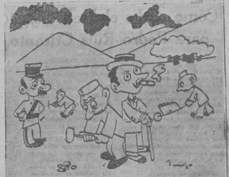
UNO DE LOS HERMANOS SIAMESES HA SIDO CONDENADO A TRABAJOS FORZADOS