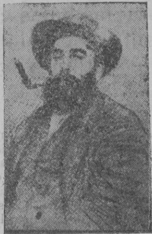
Auto-retrato de Ramón Casas

de la literatura, del arte y de la política posaron para Casas, imprimiendo a sus retratos un inconfundible sello de distinción; con un gran «savoir faire», muy nuevo, muy francés, pero muy español también, con resabios velazqueños aquellos suaves dibujos de graciosa factura, sueltos y jugosos, con destellos de gran dominador del dibujo. También cultivó la composición, y las escenas costumbristas, con ajetreo,