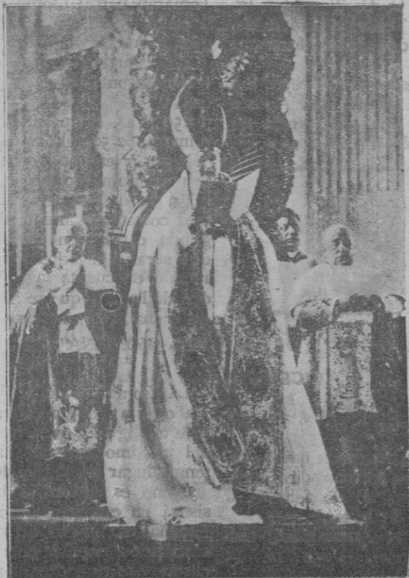
El Papa, Pío XI, leyendo su mensaje, que ha «radio» difundido por todo el mundo, en la festividad del X Aniversario de su Pontificado.