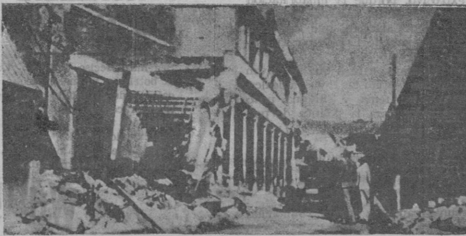
Una de las calles afectadas por el terremoto

puesta, más o menos lírica, más o menos «prosaica». Pero ninguna pareció convencerse. Entonces, se escuchó la vozecita de doña Cecilia, la señorita de compañía, «la carabina», en fin, que afirmaba: