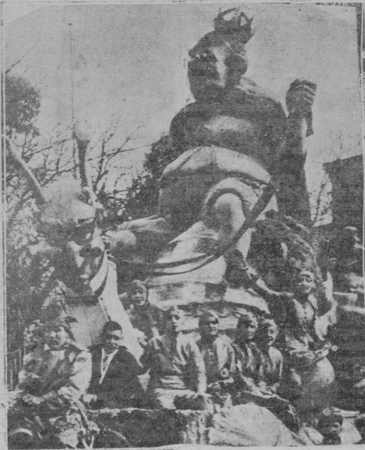
El reinado del caracol