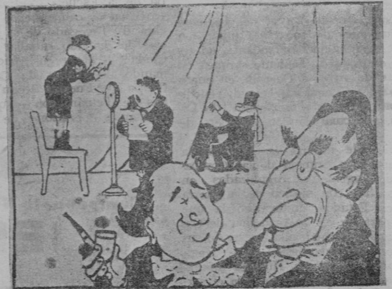
—¿Qué están radiando éstos?— —La escena del balcón de «Romeo y Julieta».