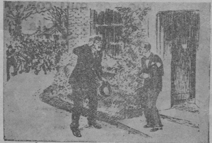
El Director del Manicomio.—¿Han cogido ustedes a los tres locos que se escaparon? El loquero.—¿Pero eran tres? ¡Pues traemos trece! (De «Passing Show», de Londres)