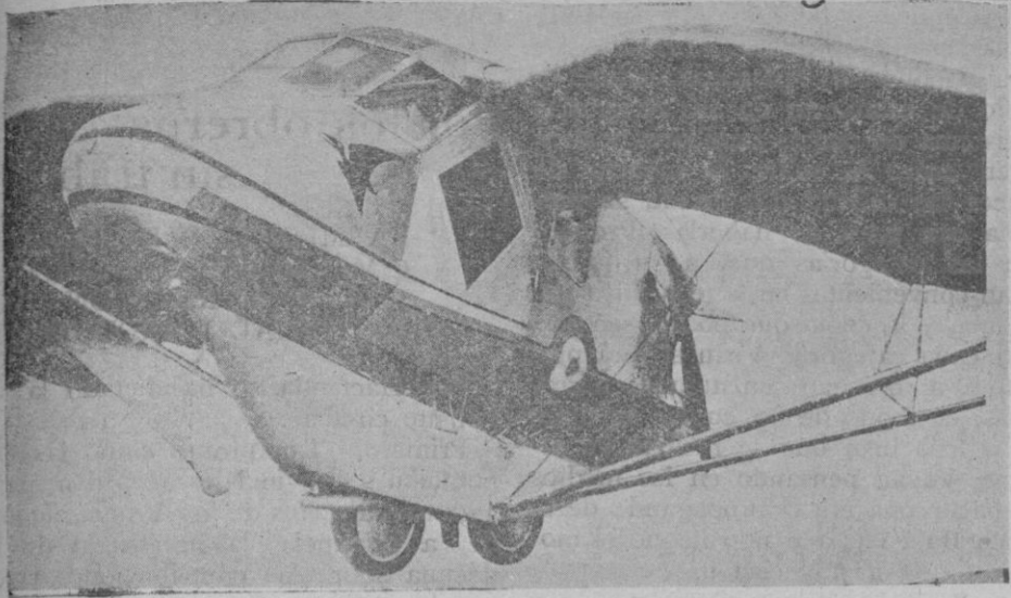
Los monstruos del aire. El «Pterodactyle», nuevo avión de construcción inglesa que por su forma extraña hace pensar en los primeros monstruos de las épocas prehistóricas