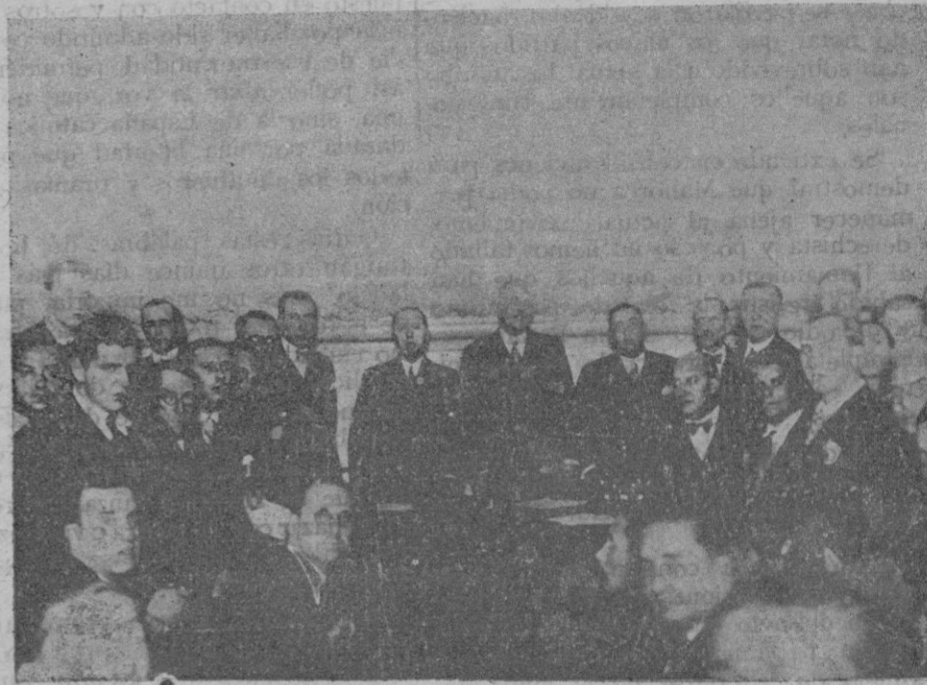
El Sr. Gil Robles en la Presidencia del acto celebrado en el Cine Moderno