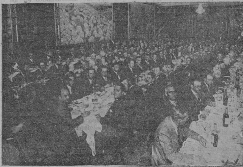
Un aspecto del comedor del Grand Hotel durante la celebración del banquete en honor del Sr. Gil Robles