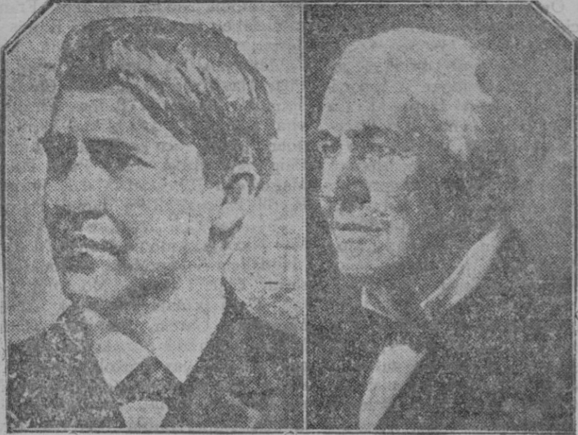
Dos retratos del famoso inventor. Cuando tenía veinte años y era un simple empleado de ferrocarriles; el otro es una de las últimas fotografías, antes de que en él se cebara la enfermedad que le ha llevado al sepulcro, en su retiro de West Orange