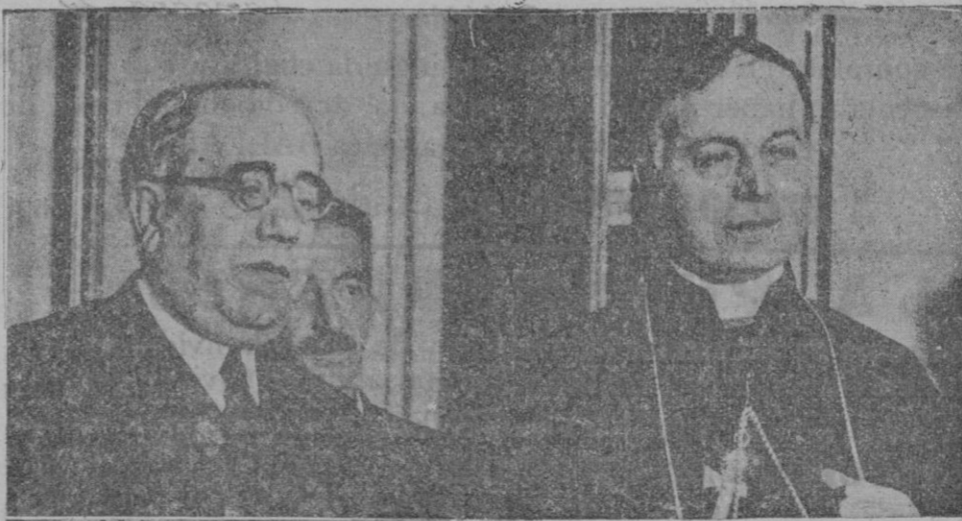
El Nuncio de S. S. Sr. Tedeschini al visitar al Presidente del Gobierno señor Azaña