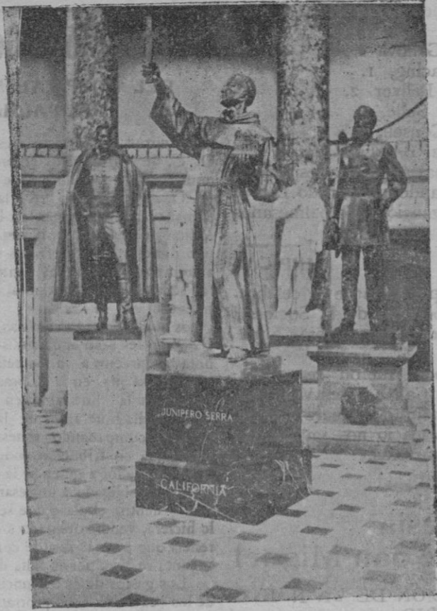
Estátua del fundador de California, nuestro ilustre paisano Fray Junípero Serra que ha sido instalada por el Estado de California en el «Hall of Fame» de Washington