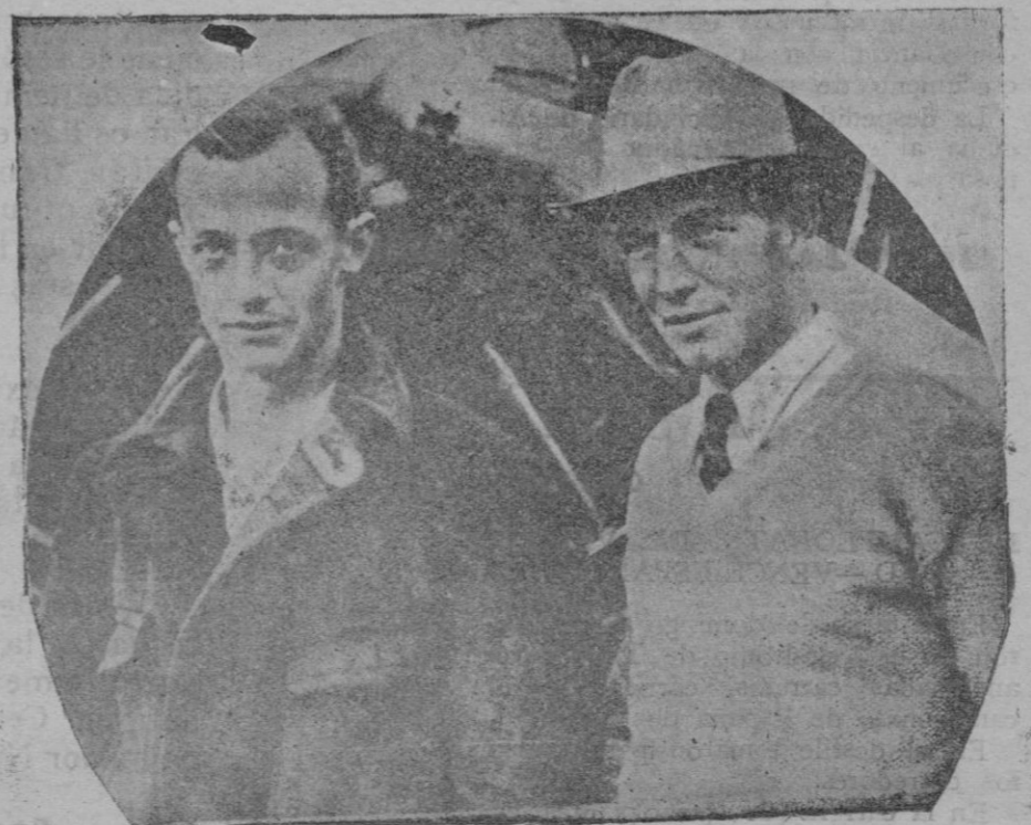
Los famosos aviadores norteamericanos Herndon y Pangborn, que han atravesado el Pacífico, desde el Japón a los Estados Unidos, en un vuelo de cuarenta y una horas