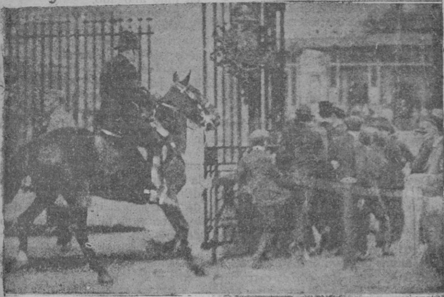
La policía montada dando cargas contra los grupos que habían asaltado varios establecimientos