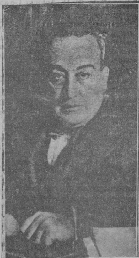
D. Juan Esteban Montero, que acaba de ser elegido presidente de la República de Chile. Tiene 55 años y es un ilustre jurista.

El despacho particular de don Alfonso—pieza grande, rectangular—tiene su mayor testero cubierto de cabezas de venados y otros trofeos de caza. Al lado, un cuarto pequeño: la biblioteca particular, ya que para satisfacer sus apetencias de lectura le suministraban los libros su bibliotecario mayor. En esta pequeña biblioteca hay pocos volúmenes: los cuatro tomos del «Busquejo de la Historia Militar de España», de Almirante; los siete de las obras completas de Cervantes y los doce de la obra dictatorial «Progreso de España en el período de 1923 a 1928».