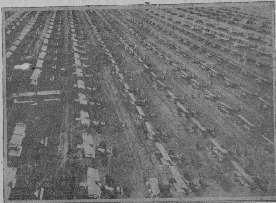
Perspectiva que ofrecía el aeródromo de Ferrara, donde se ven alineados doscientos aviones militares que tomaron parte en las grandes maniobras celebradas por la aviación militar italiana

Una buena fermentación se opera entre los 22 y los 30 grados, por ser la temperatura más favorable a las levaduras.