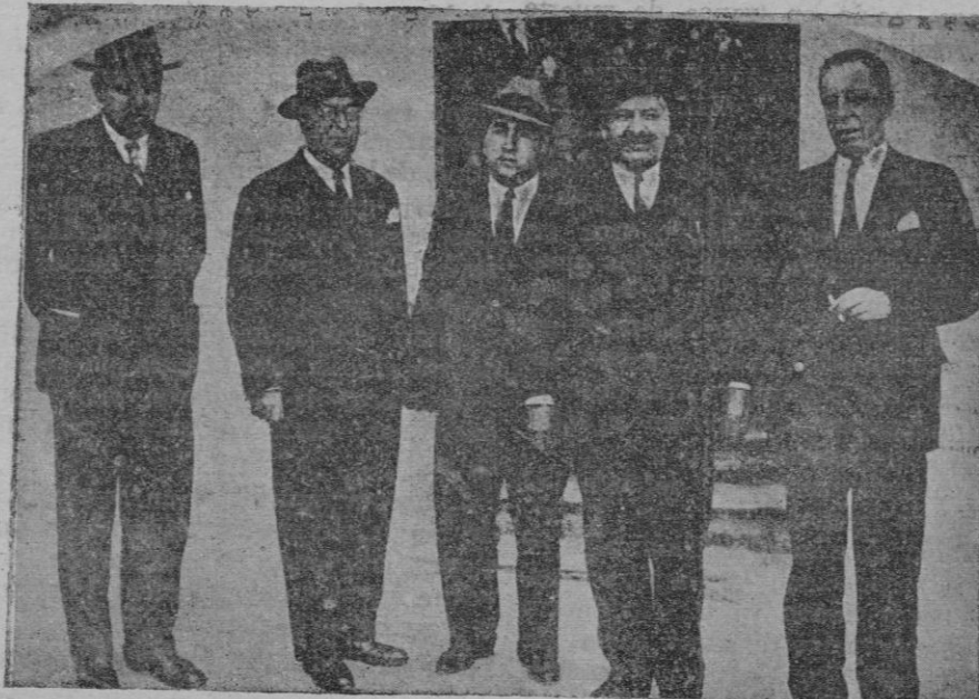
Los señores que forman la comisión cuyas decisiones que han originado la detención de los ex ministros de la Dictadura, tan tos comentarios ha levantado, al salir de Prisiones militares, después de interrogar a los detenidos