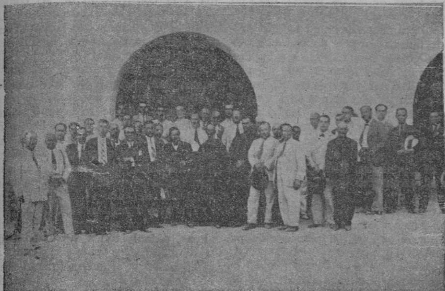
Los excursionistas mallorquines con autoridades y personalidades ibicencas en el atrio de la iglesia de Sant Jordi