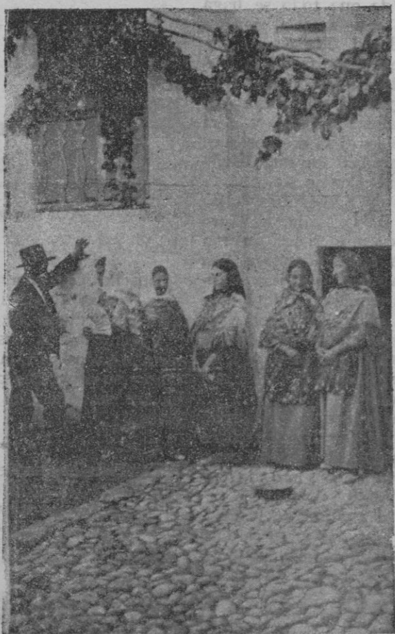
Las señoras y señoritas mallorquinas, vistiendo el típico traje de payesa ibicenca