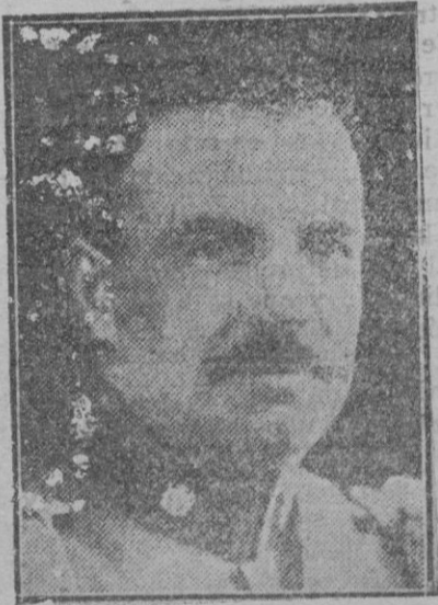
El general Ibáñez, que ha resignado los poderes, abandonando Chile

netica multitud de autos retornando a sus mansiones de ensueño, a todas aquellas familias dichosas que moran en la grandiosa playa pollensina del turismo mundial, quedando en la terraza los noctámbulos del Crucero, observando el firmamento y deduciendo que la salida de Pollensa podía efectuarse a las tres y media de la madrugada.