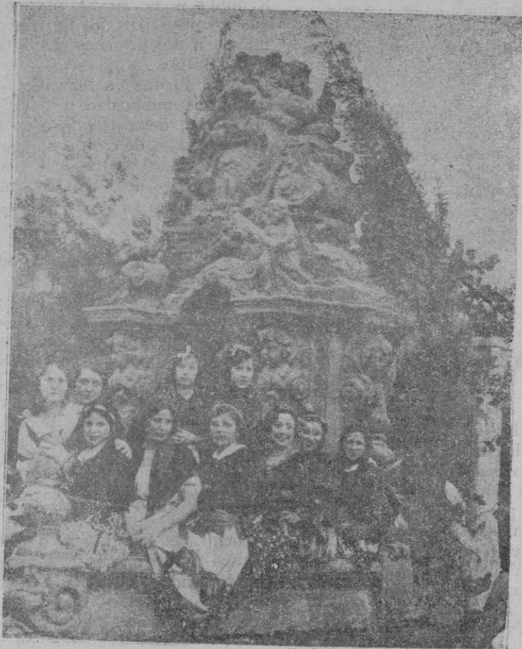
La carroza de Castilla la Nueva, formada por uno de los templetos del Puente de Toledo, una vista de los Jardines de Aranjuez y uno de los típicos soportales castellanos