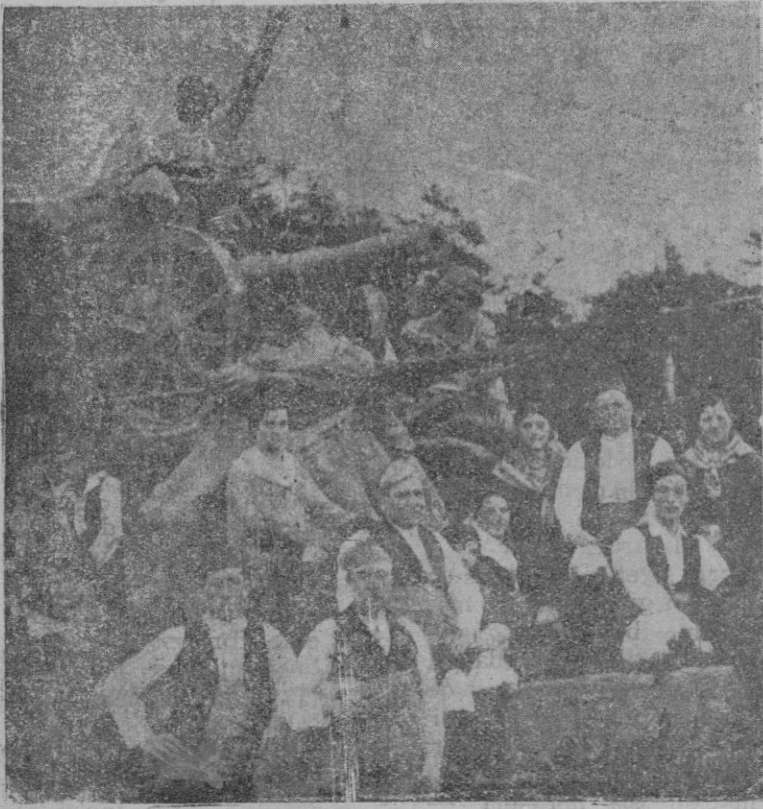
La carroza de Aragón y Navarra, con un grupo de Agustina de Aragón

También figuraba en la cabalgata una carroza de Baleares y Canarias de la que no hemos podido obtener fotografía. Simbolizaba en su parte anterior un jardín, en cuyo fondo aparecía un detalle de las renombradas caevas de Artá, y en sus partes laterales plantas de la flora tropical, sirviendo de fondo el Pico de Teide. En su parte posterior una cabaña con grupos de pescadores