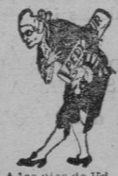
A los pies de Vd.