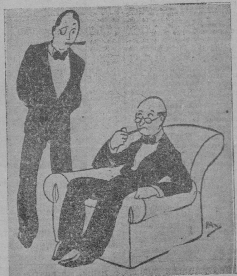
—¿Cuántas veces pediste la mano de tu mujer? —Una... de más.