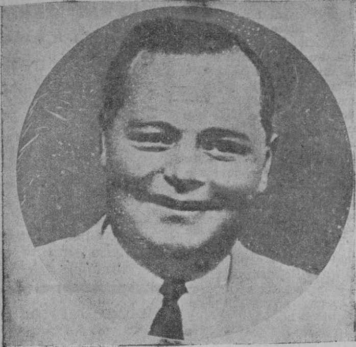
El célebre actor de la pantalla yanqui «Fatty» que acaba de morir en la mayor miseria