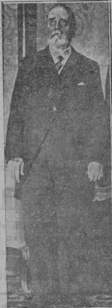
Don José Sánchez Guerra que en cargo de tomar Gobierno, declinó por la falta de asistencia de las extremas izquierdas