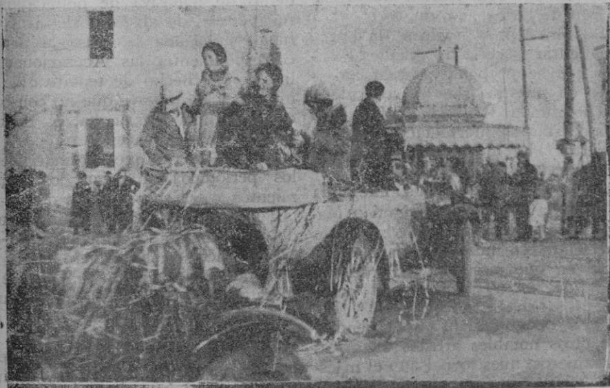
Varios aspectos de la rúa