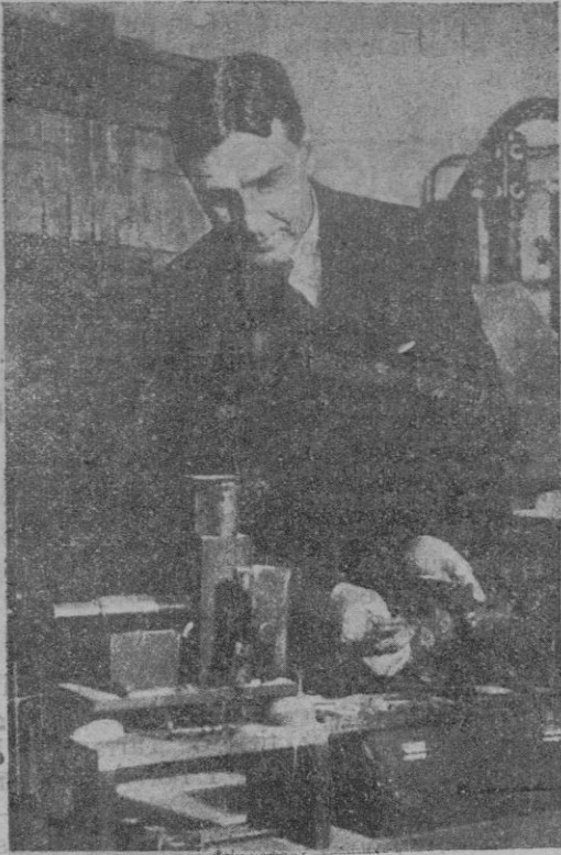
Yale (Estados Unidos).—Mr. Alois F. Kovarich, profesor de Física de Yale, que ha fijado la edad de la Tierra en 1,852.000 años según cálculos realizados con el radium, sobre rocas del Norte de Rusia.