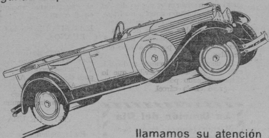
Uno de los tipos de serie de Nacional Pescar.

Organizando su red de Agencias participa a los interesados que todavía quedan algunas disponibles, y por lo tanto