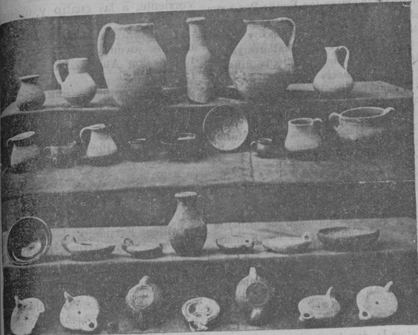
Objetos de cerámica romana descubiertos en las excavaciones de «Pollentia» (Alcudia)