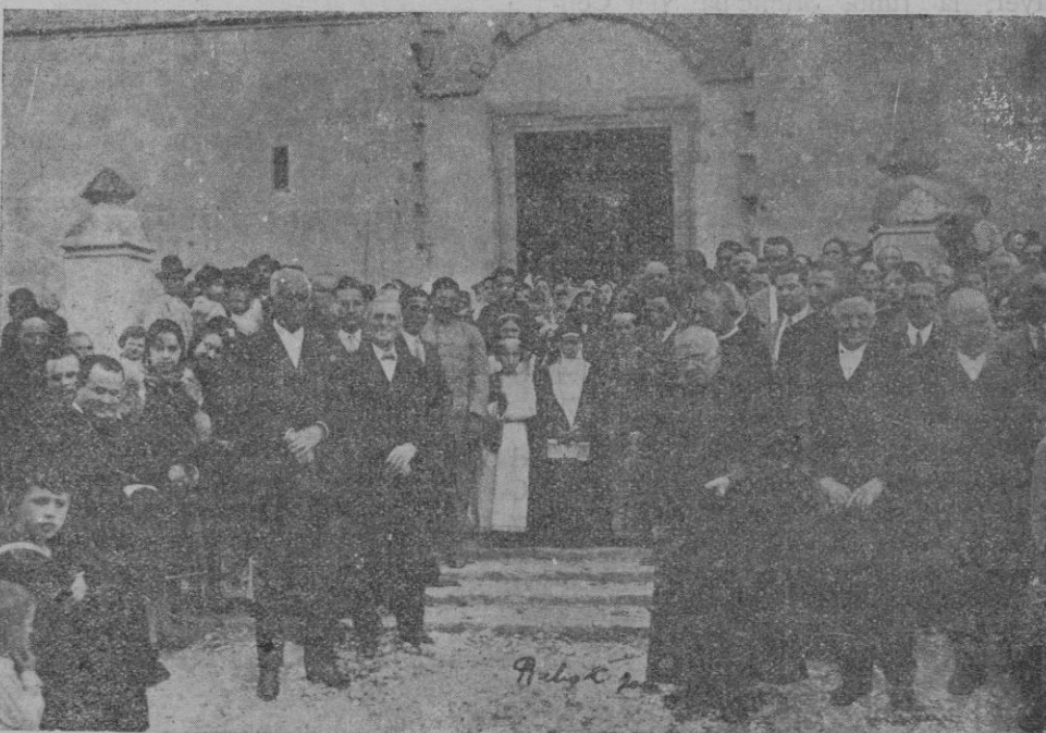
Aspecto que ofrecían las Autoridades y comisión organizadora al salir de la misa solemne el día de la fiesta

cauzaran al mismo por rutas eficaces y salvadoras. Para terminar le diré que considero que la paridad que actualmente debe corresponder a la peseta en función del nivel interior de precios oscila entre 43 y 44 por libra, sin que esta opinión mía constituya una hipótesis acerca del tipo a que, en su momento, pueda hacerse la estabilización.