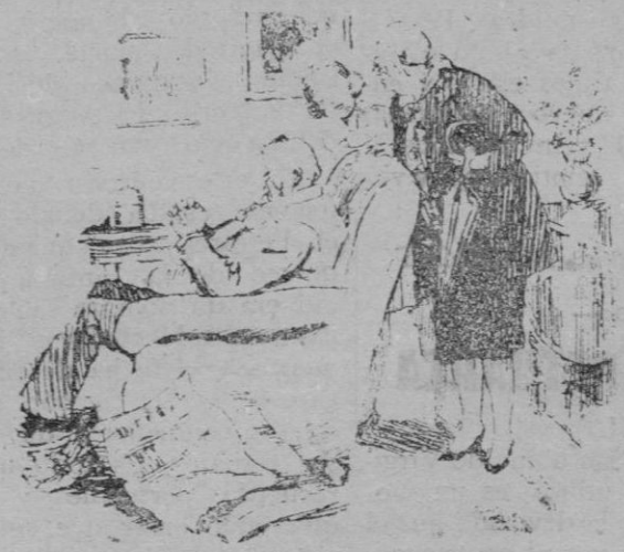
—Mira qué araña tiene tu abuelo en la cabeza. —No es una araña verdad. Se la pinta para ahuyentar las moscas.