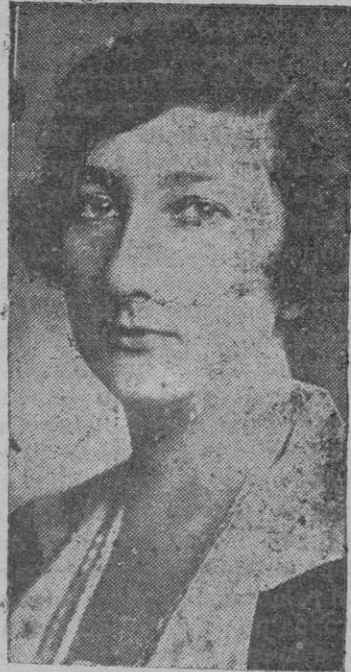
Efectuado el enlace entre el rey Boris y la princesa Juana de Italia, y ya se anuncia otra boda: La del duque de Spolletto, hijo del duque de los Abruzos, de Italia, con la princesa Eudisia, hermana del rey búlgaro

moderno Juglar, como él se llama, señor García Sanchiz, que entretuvo agradablemente al auditorio, que con calurosos aplausos interrumpía con frecuencia los brillantes párrafos y finas observaciones del disertante al describir sus numerosos viajes por España, coronando con una gran ovación el final del parlamento que duró, sin cansar, más de hora y media.