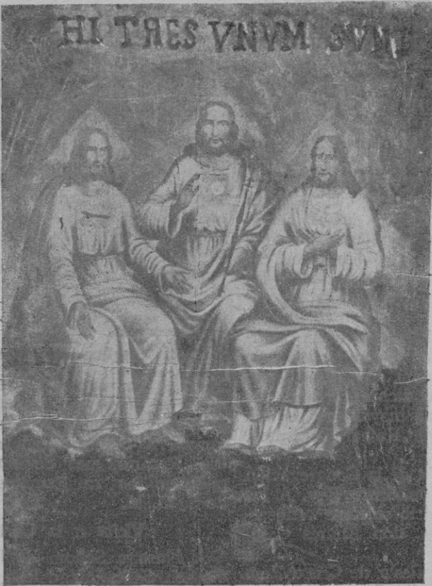
Quadro de l'Esperit Sant en forma humana

Qui no ha reparat entrant a la Seu pe's portal de l'Almoyna, després d'haver devallat aquells cinc l'rgs escalons, a ma' esquerra i aferrada a sa paret una antiga Taula, calaixera, tota ella de llenyam vermell. Ido aquesta es sa taula de's pá beneit en la qual sa