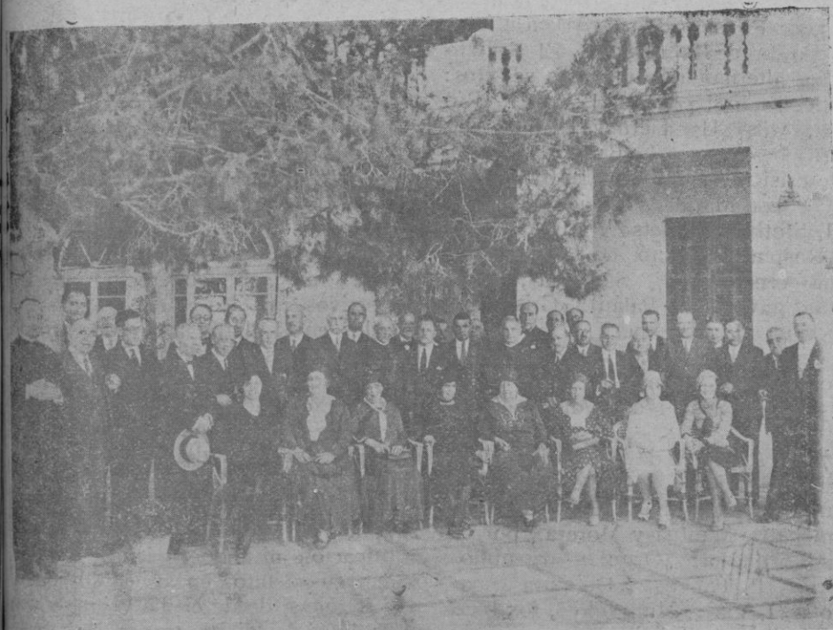
Grupo de los asambleístas