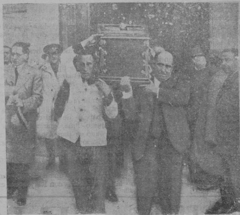
La servidumbre del General sacando el féretro de la casa mortuoria