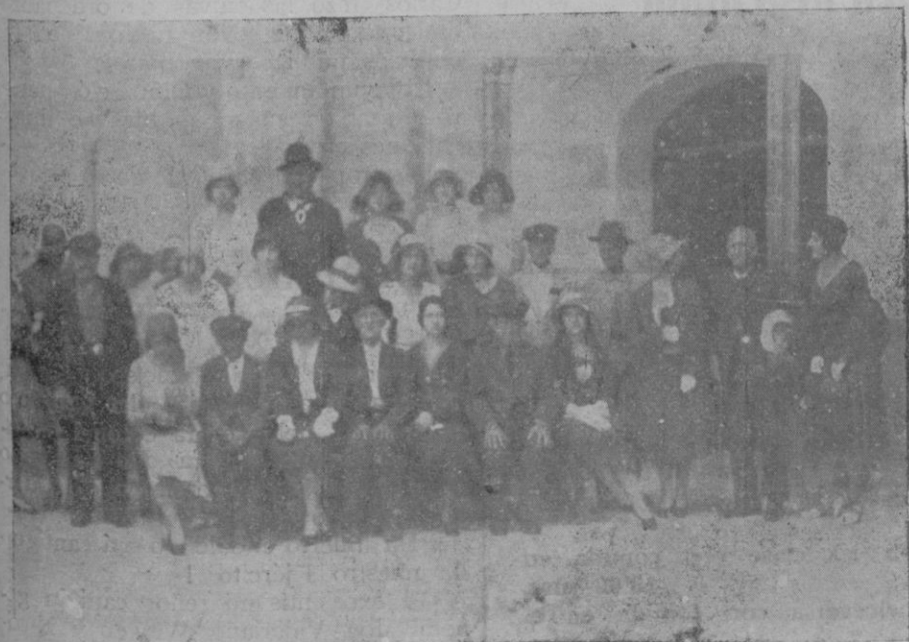
Las madrinas con los marinos pensionados