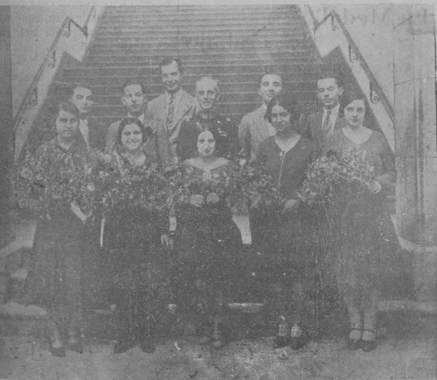
Las señoritas que aportaron su cooperación musical, con el Sr. Comandante de Marina y la comisión de jóvenes delegados para la organización de la fiesta.