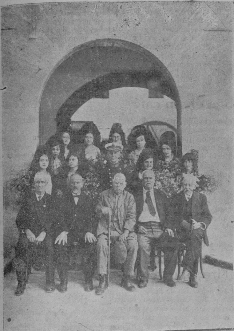
Los marinos pensionados, con el Sr. Comandante de Marina de Sóller y las señoritas que actuaron de madrinas.