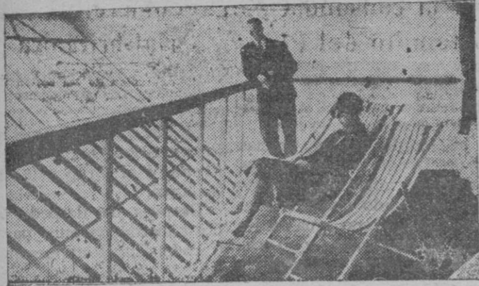
Uno de los miradores del dirigible