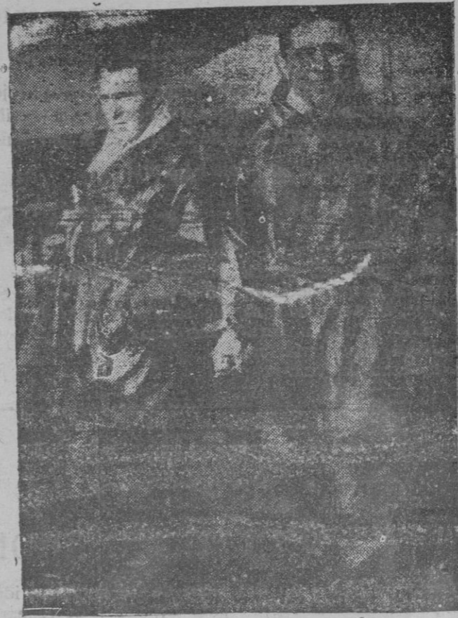
Costes y Bellonte, que acaban de hacer el magnífico vuelo Paris-Nueva York

regreso a Amsterdam, a la isla de Marken, ciudad aquella e isla ésta que viven mayormente de la pesca, disponiendo respectivamente de un puerto capaz para un centenar de embarcaciones cuyas cuadradas veas de un rojo perdido ensangrientan con su reflejo las aguas color de plomo. Las casas son de madera, interiormente adornadas con cerámica de Delft y con esas mil bagatelas o chucherías que tanto halagan la vanidad femenina. Los viejos marinos, cachazudos y filósofos, fumando su pipa, las manos en los bolsillos de los anchos pantalones, hacen resonar los zuecos sobre las tablas del muelle que aminoran los piones de madera pintados de negro, en tanto que las holandesitas, tocadas de picudas cofias de encaje, ceñido el busto en negro jubón que cae puntiagudo sobre la cadera, en contraste con la holgada falda de vivos colores, se pasean haciendo truco, se dejan retratar pidiendo luego «money for the little girl», lo que prueba que, como en todas partes, los turistas ingleses están en mayoría. En Marken es más marcado todavía el color costumbrista. Su vestido nacional, recuerdo del atavío germánico del tiempo bárbaro, tiene algo de la vistosidad oriental por la vivacidad de los colores. Los niños visten de igual manera, así es que pronto se ve quien es del país y quien turista, con lo cual ganan los naturales y ganan los visitantes, cuya curiosidad se satisface tan sólo ante el ambiente local, ante lo típico en sus diversas manifestaciones.