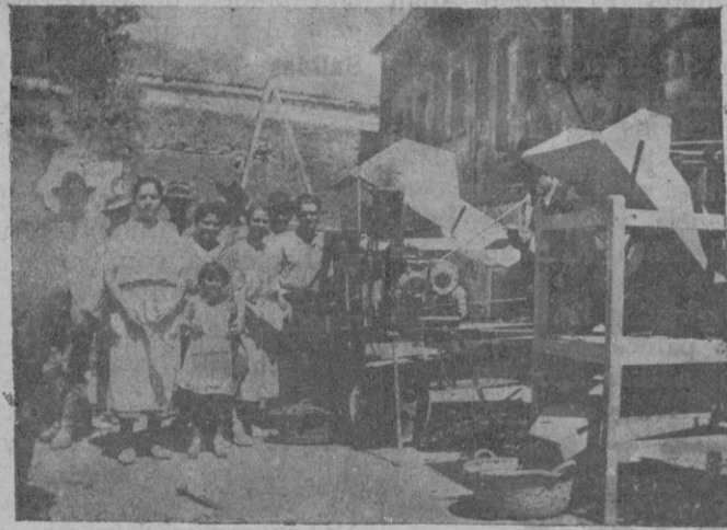
Grupo de descortezadoras de almendras