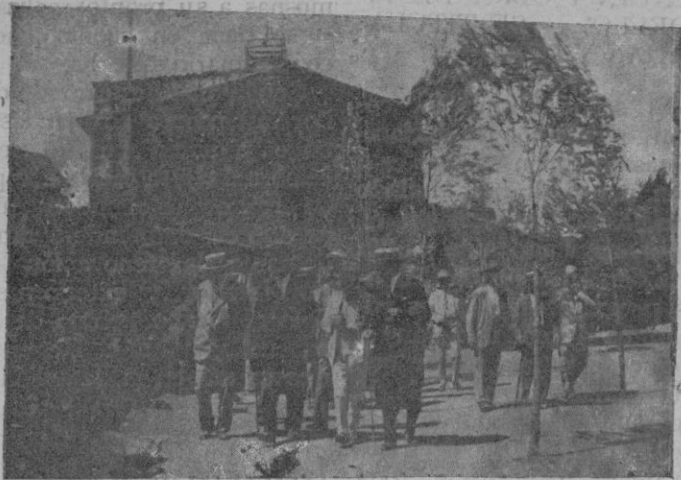
Inauguración de la exposición. Figuran en primer término, el Alcalde, el Jefe Municipal, el Presidente de la Asociación Provincial de Ganaderos y el de la Junta local