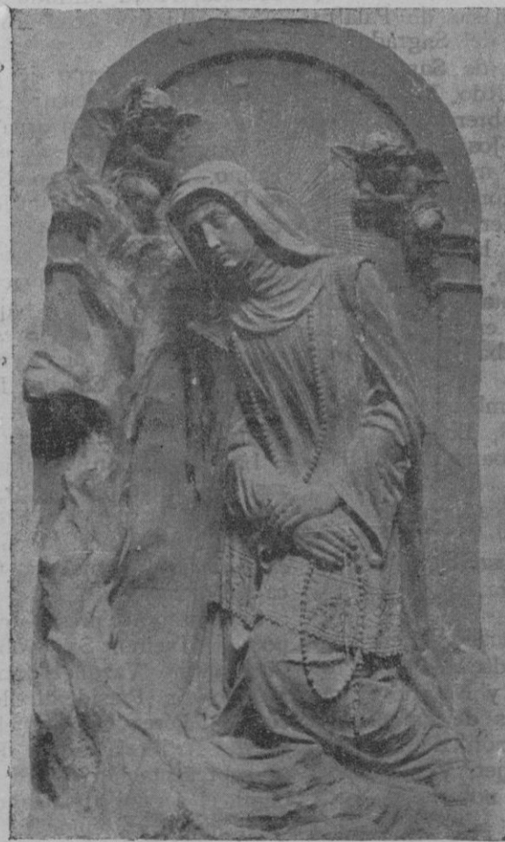
Escultura de Sta. Catalina Thomas. — Encargo de los Excmos. Sres. Condes de Alba Real del Tajo que se está colocando en el antiguo e histórico molino de la Beata de Valldemosa, escultura en piedra policromada original del escultor señor Vila

mo el lirio y bermeja de amor como la rosa escandecida. En la plaza de Santa Magdalena se agolpaba una multitud indecible, ferviente, entusiasmada, ¡y qué ovación que la que se tributó a la humildad de Santa Catalina al entrar nuevamente en su Convento! Momentos inenarrables plenos de una emoción que no hay pluma que expresarlo pueda! Después, nuevamente la ovación delirante desgarrando el sagrado silencio del templo, imponente, avasalladora; la nota de menarite emotividad de su entrada en la clausura, sus hermanas esperándola, foros de alegría, en dos largas hileras, también con la luz de su lámpara despabilada y brillante; la emocionante entrega de la sagrada reliquia; y el desfile de las Siervas del Señor, como visión ultraterrena, tras las altas y gruesas rejas, transportando su amadísimo tesoro, y colocándolo en el puesto de honor desde donde, durante tantos años, oyó las plegarias y los llantos de su pueblo sobre el que se levanta esperanzadora y sonriente... Día de recuerdos imborrables, como el del pasado domingo, fué el de ayer, recuerdos que perdurarán en la mente