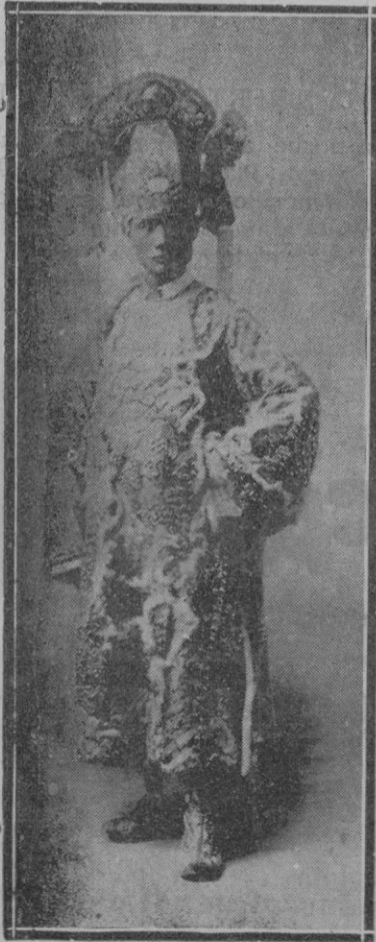
El pintoresco torero chino que debutará mañana en la Plaza Antigua de Palma