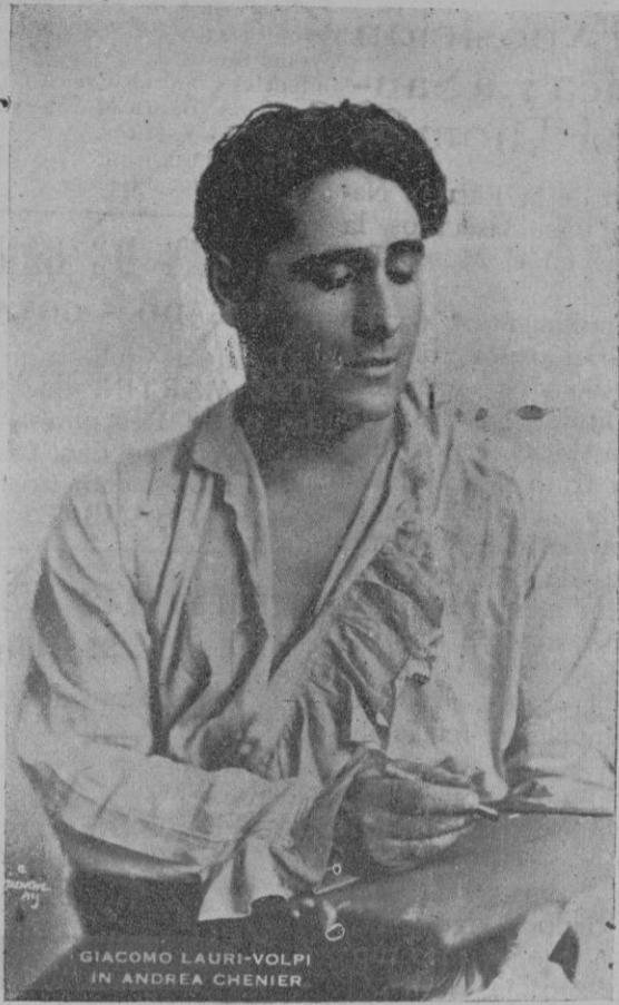
GIACOMO LAURI-VOLPI IN ANDREA CHENIER

El famoso divo que se presenta esta noche en el Coliseo Balear