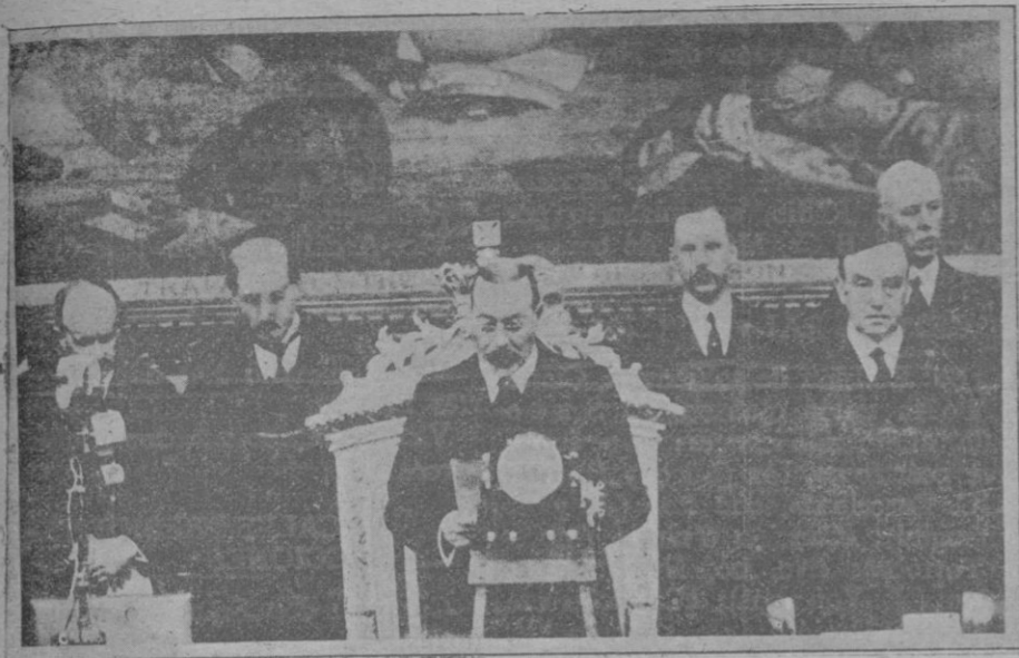
El Rey de Inglaterra pronunciando ante el micrófono el discurso de apertura, que fué radiado a todas las partes del Globo