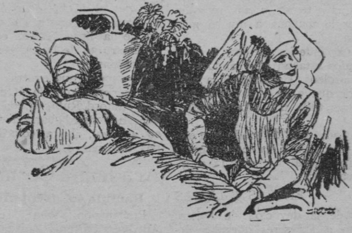
La enfermera bonita.—Creo que está mejor, doctor. Se ha pasado la mañana guiñándome el ojo.