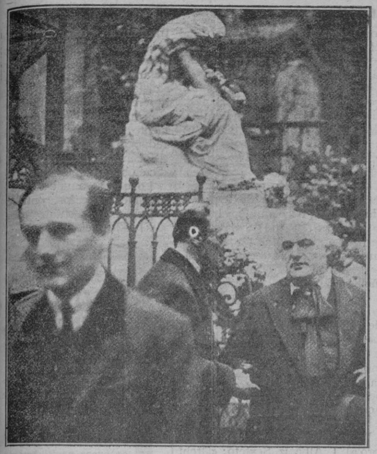
Paris.—En el «Père Lachaise». Ceremonia ante la tumba de Chopin con motivo de haberse cumplido ochenta años de su muerte