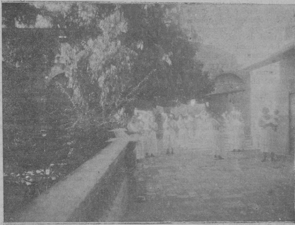
Terraza y jardín de la Inclusa

La cuestión es escoger para la primera y no puede hacerse al tuntún quien toma una carta de crédito de manos de un prestidigitador sino después de maduro examen y pulsar necesidades y posibilidades. Ordenar el trabajo; emprender con muchas cosas a la vez, es llamar la atención, es marcar la labor imperfecta. Los edificios tienen ante sí el problema de las aguas; es el problema de la urbe, que es de trascendencia, si bien no es de urgencia; el «grós public» no debe perder la importancia de la obra, que la ciudad cobrará el estímulo de la conquista toda población que se preocupa de la higiene y cumplirá con la orden expresada en el Estatuto Municipal de subvención de la reforma y mejora a la luz de un perfecto alcantarillado. El Sr. Zaforteza había escrito la puma, que llegó a nuestras manos la noche de la sesión municipal del lunes. La verdadera complacencia nos