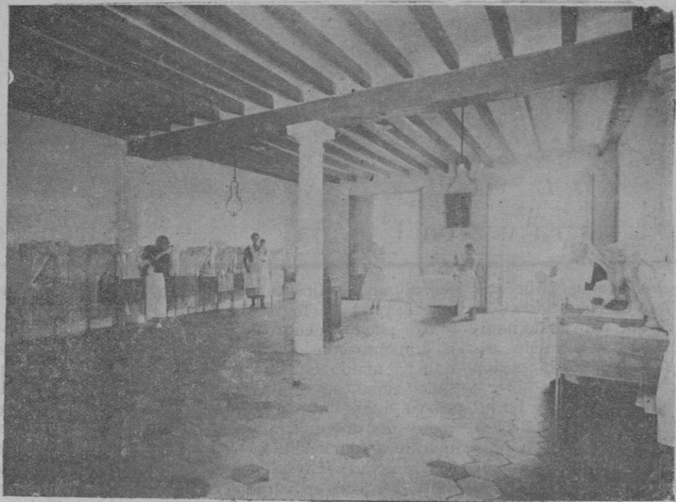
Una de las salas de la Inclusa