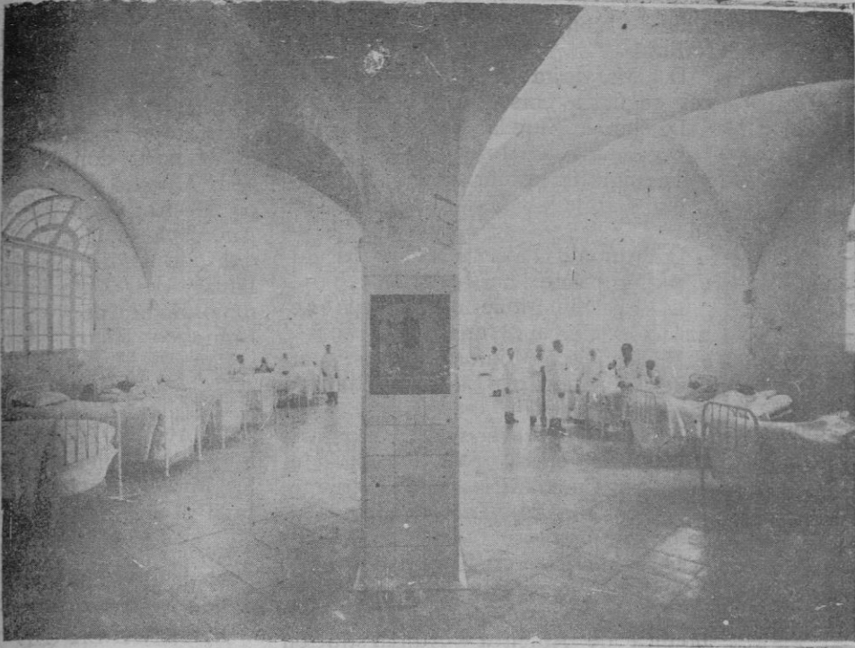
Una de las salas del Hospital Civil

DE LA COLECCION DE FOTOGRAFIAS QUE HAN ESTADO EXPUESTAS EN LA DIPUTACION Y ENVIADAS A LA EXPOSICION DE BARCELONA