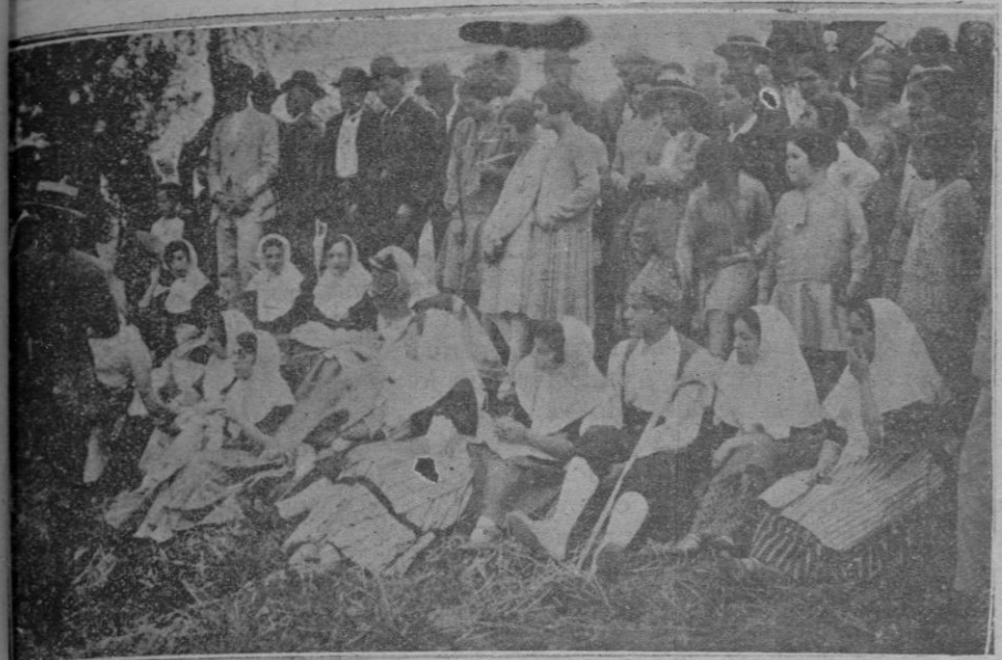
Grupo de distinguidos jóvenes de la colonia veraniega de Valldemosa que haciendo el típico traje mallorquín tomaron parte en las fiestas de la Beata Catalina Thomás