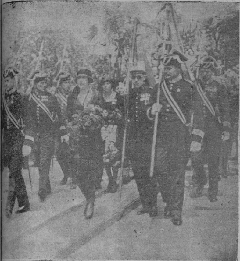
de las banderas del Tercer tercio de la guardia civil y del de Barcelona.—S. M. la Reina y S. A. R. la infanta doña Beatriz, escoltadas por el Real Cuerpo de Alabarderos