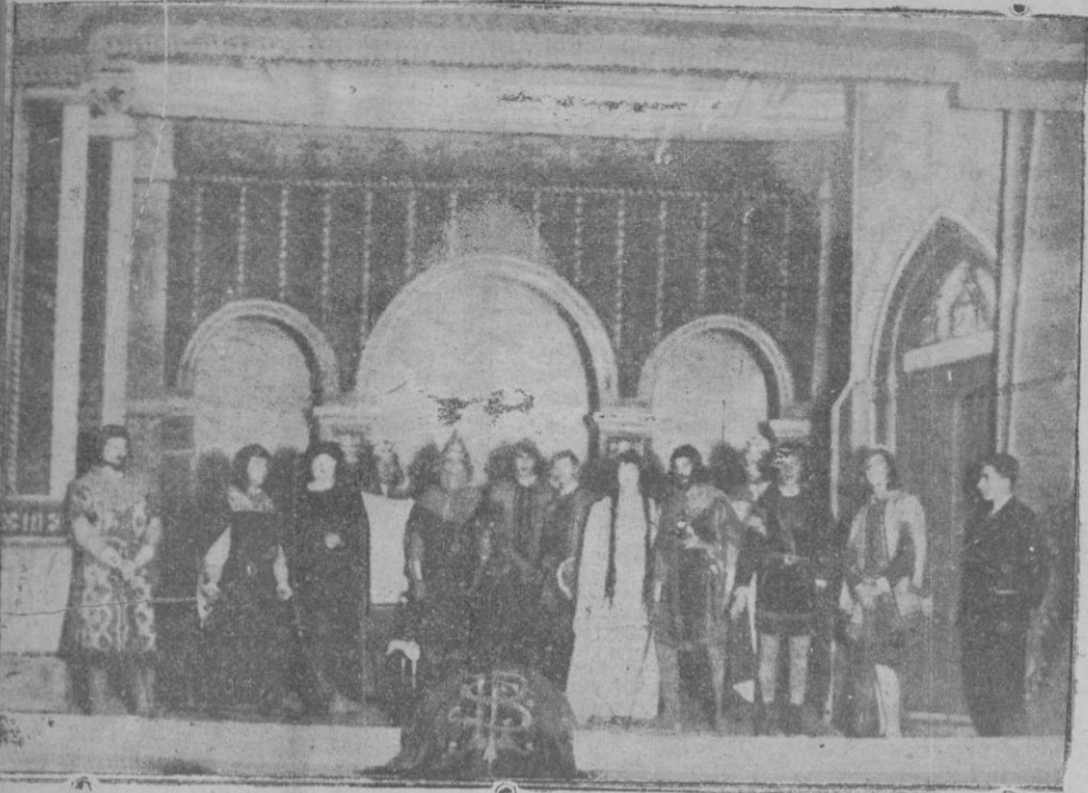
Los aficionados socios de «La Protectora», que tomaron parte en la representación de «La Compañía de la Almudaina»