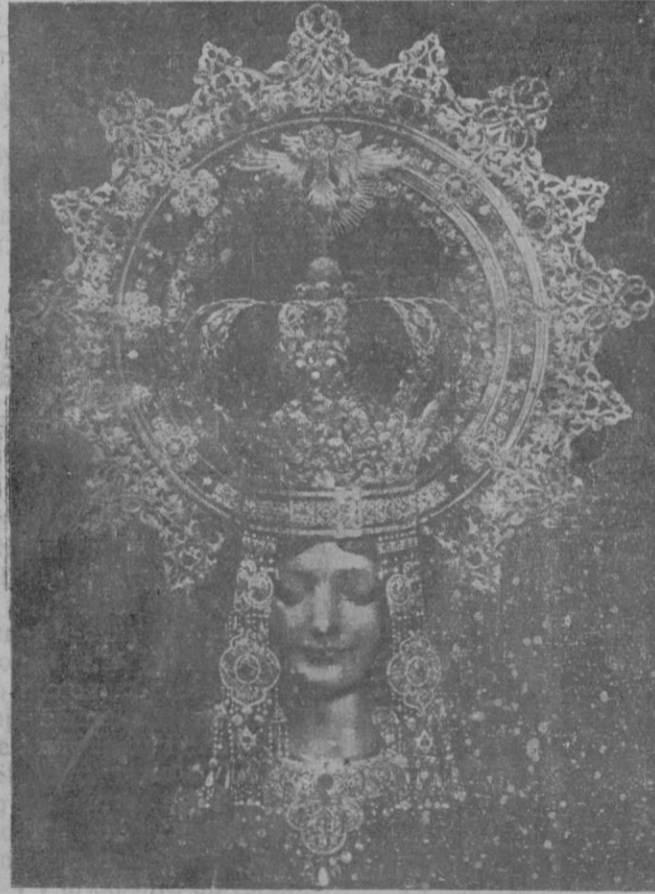
La imagen de la Virgen con la valiosísima corona de oro, platino y piedras preciosas, cuyo detalle publicamos días pasados

naba al trono de Rusia, que debía heredar el gran duque Nicolás. El enamoramiento de la bella Dagmar presagiaba un hogar feliz, «rara avis» en las parejas imperiales rusas, temerosas del nihilismo y sometidas al inquisitorial influjo de los procuradores del Santo Sinodo. Pero el matrimonio se frustró. El gran duque Nicolás murió, de muerte natural, a los veintidós años, y la princesa Dagmar se prometió, por consejo de su padre, el emperador coleccionista de coronas, al nuevo heredero, el gran duque Alejandro.