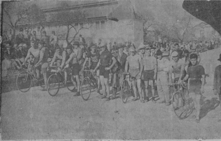
Los corredores que tomaron parte en las carreras ciclistas