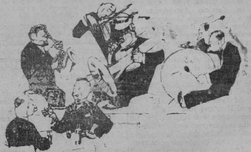
—Por qué te has colocado tan cerca del trompón? —Chico, porque corre aquí un fresco...