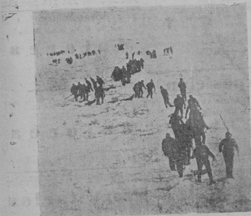
Una de las expediciones en busca de los compañeros de Nobile