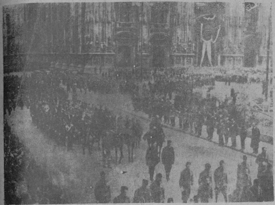
Solemne entierro de las víctimas