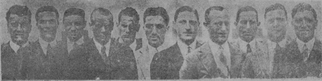
El equipo italiano que luchó con el español en Gijón