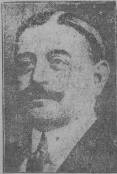
El ex-ministro y Alto Comisario en Marruecos don Luis Silvela, fallecido el domingo en Madrid

carnes blancas asadas, pescados cocidos, postres sencillos, gran cantidad de verduras y sobre todo cenas ligerísimas, por ejemplo: un vaso de leche y compota o un poco de pescado y fruta suelen dotar a la persona que sigue este régimen un cutis limpio de menudos defectos además de hacerle gozar de mejor salud.