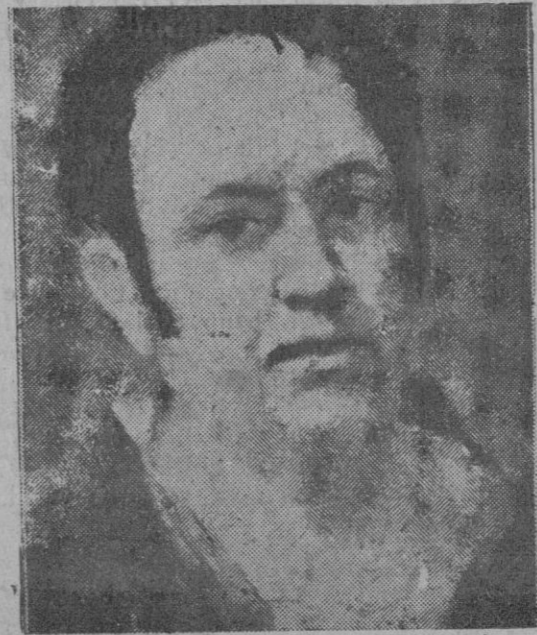
Goya, pintado por López