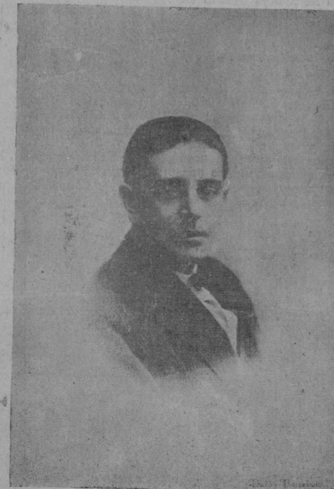
El primer actor Ricardo Galache