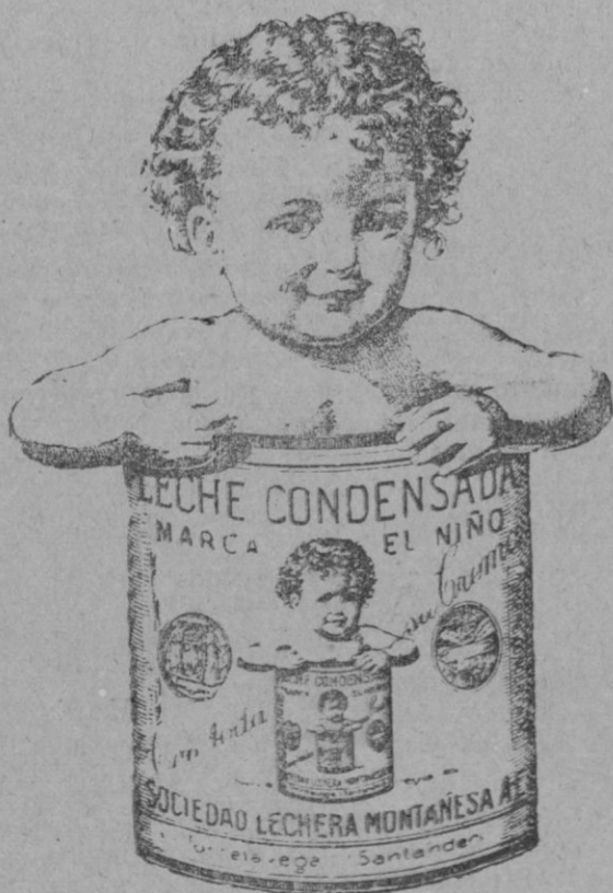
LA GRAN MARCA NACIONAL