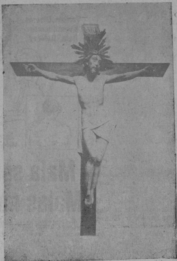
La venerada imagen de la iglesia del Socorro que esta noche es llevada en la solemne procesión del entierro