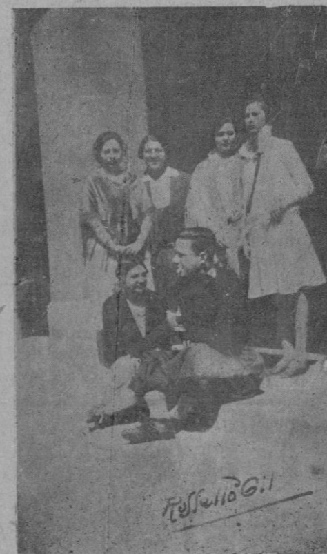
Grupo de señoritas maestras y de un joven vestido con el típico traje de payés, que sirvieron el desayuno con que los Maestros obsequiaron a los excursionistas