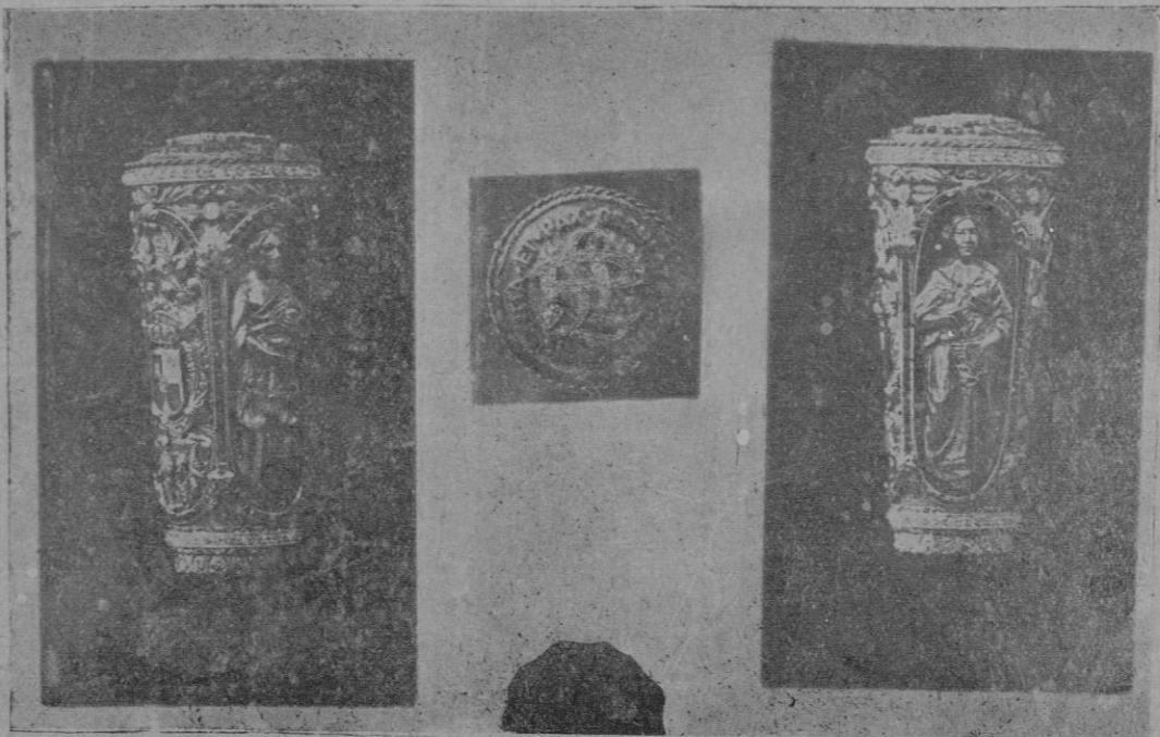
El artístico puño del bastón regalado al Sr. Gobernador, obra de la Casa Coda