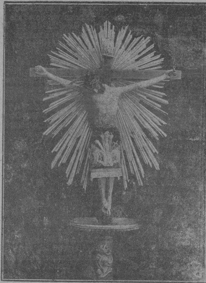
La venerada imagen de la Sangre de Nuestro Señor Jesucristo adorada por toda Palma en la procesión de hoy

amor al compás de la vida; cuando él fué «poco hombre», y ella «frívola», «poco madre». El hijo de la frivolidad no es el narciso; es la flor de un día; si es que llega a ser flor! Pero, otra vez