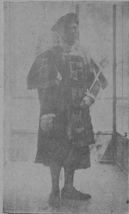
Uno de los maceros de la Diputación, con la dalmática que estrenarán en la procesión de esta tarde

Nacen en marzo y en marzo comienzan a abrir sus perfumadas corolas.