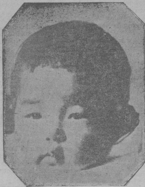
La princesita japonesa Hisa, que acaba de morir víctima de la epidemia de gripe que sufre el Japón.