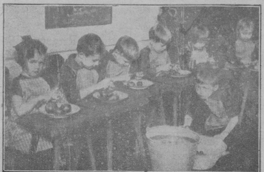
Se enseña a los niños a cocinar: la faena de pelar patatas