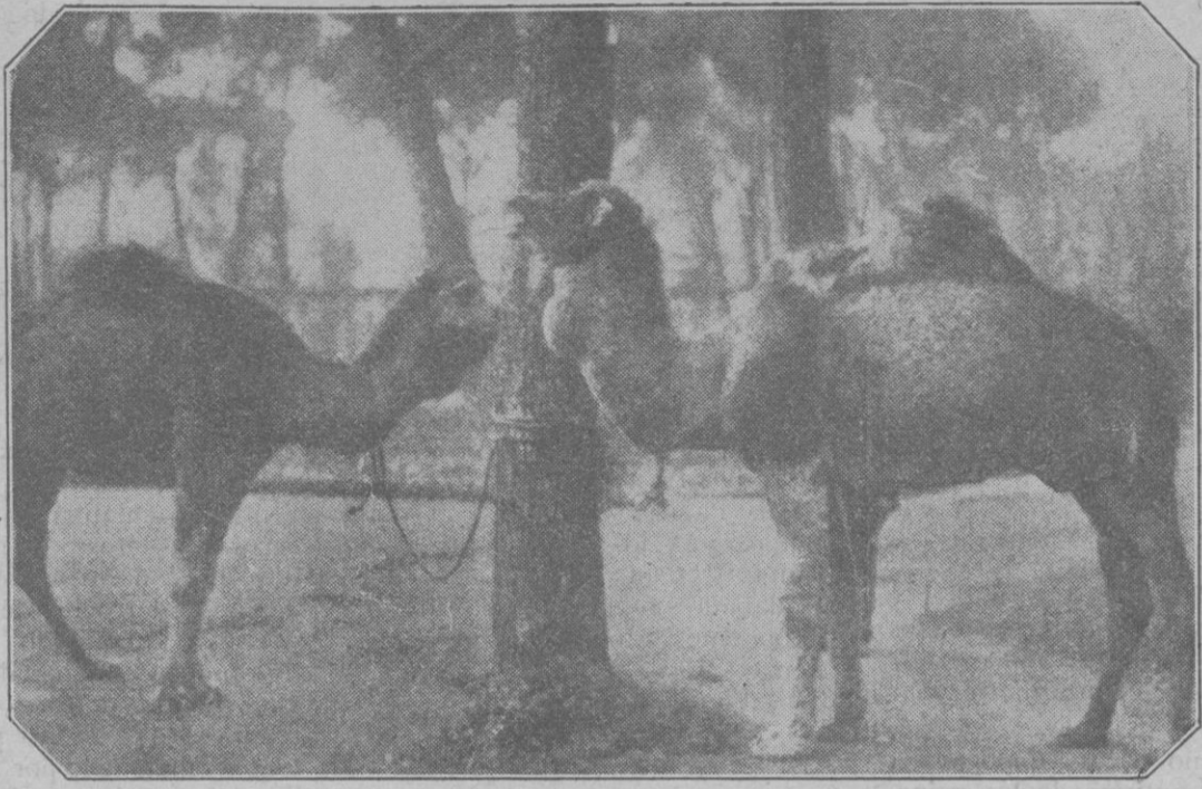
Dos camellos que regalarán a S. M. el Rey, y que éste ha donado al Parque Zoológico de Madrid