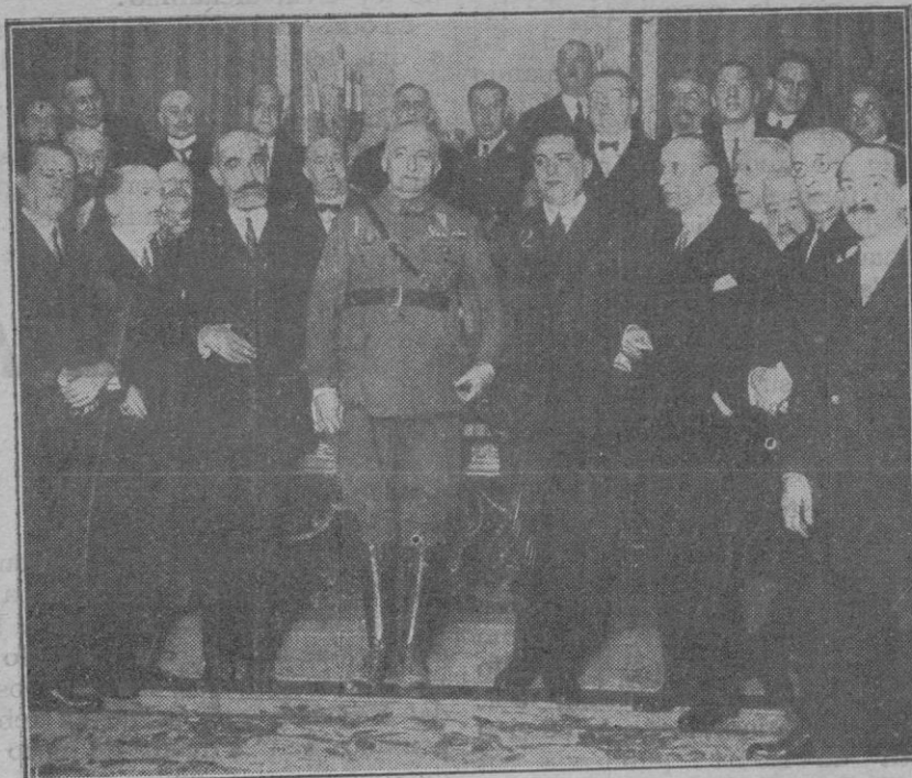
El jefe del Gobierno y el Ministro de Hacienda en la reunión de Delegados de Hacienda

tentaba hacer pasar como cosa buena. Es un éxito de nuestras apreciaciones sobre ellos. Me produce viva satisfacción poder consignar que nadie ha tenido el valor de apodrirarlos.