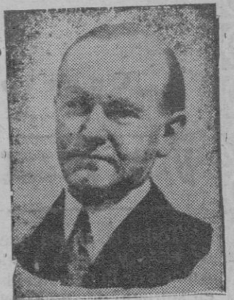
Mr. Coolidge, presidente de los Estados Unidos, que ha estado en la Habana, donde presidió la conferencia panamericana.