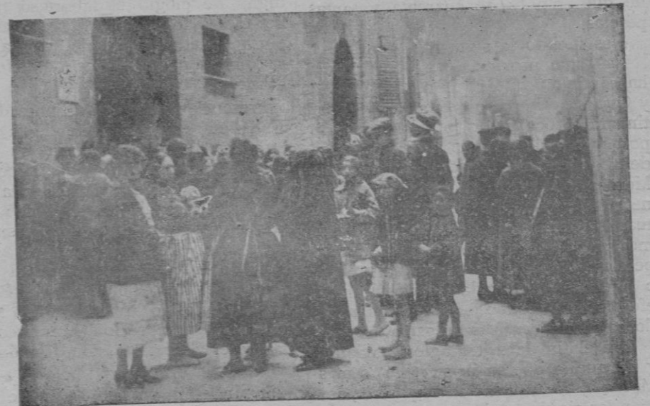
Aspecto que ofrecía ayer tarde, a las tres y media, la entrada, por la calle del Sol, de la Caja de Ahorros.—La gente se agolpaba para ganar la puerta